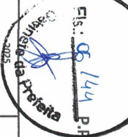
Fig. 144 P.R.A. 2022/2025